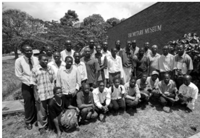
De fotografen van de Mutare Photographers Association bij het Mutare Museum

Wat ons met name is bijgebleven van onze tijd in Mutare waren de erg vriendelijke mensen. Niet alleen 'onze' fotografen maar ook vrijwel een ieder die je ergens in de stad of daarbuiten tegenkwam. Wat ons heeft verbaasd is dat er naast de enorme armoede veel grote auto's, dikke Mercedesen en vette 4wd's rondrijden. Verreweg de