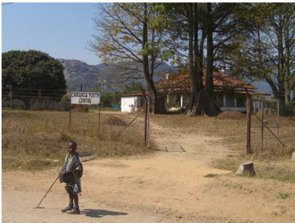
Chikanga Youth Centre