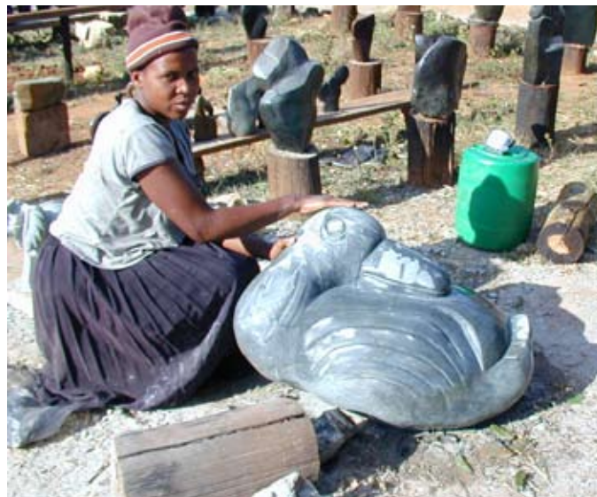
Een van de beelden wordt gemaakt in Mutare

Mutare en Haarlem delen de gierzwaluw, die heen en weer