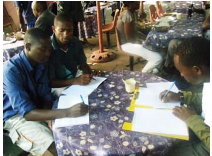
Een werklunch in The Carvery

onderzoek te doen en zich te laten inspireren. Ze hebben 'the odd one out' in Mutare geprobeerd te vinden. Ze hebben interviews gehouden om te achterhalen wat normaal is en wat niet. Ze hebben het gedrag van de massa geobserveerd. En daar zaten we vervolgens met een bult observaties, interviews en persoonlijke verhalen maar nog steeds geen theatervoorstelling.