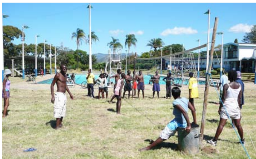
Sport leaders Mutare.

e-mail: info@haarlem-mutare.nl website: www.haarlem-mutare.nl Tel. 023 - 5324008 bezoekadres: Mondiaal Centrum Lange Herenvest 122 Haarlem