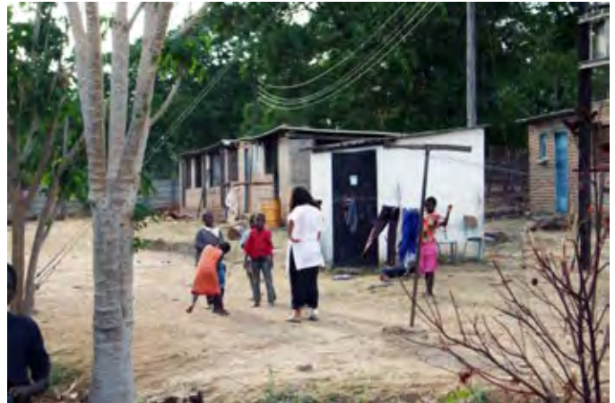
Centrum voor aidswezen

Op de terugreis naar Harare waar we verblijven worden we weer getroffen door de schoonheid van de natuur hier. Het bergachtige landschap tussen Harare en Mutare is prachtig. De rotspartijen worden afgewisseld door vlaktes en bosgebieden. Overal bloeit de paarsblauwe Jacarandaboom langs de weg. We passeren talloze grote boerderijen en stukken landbouwgrond, die ernstig verwaarloosd zijn. Deze zijn in het verleden onteigend. Een efficiënt gebruik