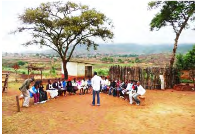
Peer education bijeenkomst op het platteland

Hoofdpersoon was een vadsige blanke Zuid-Afrikaan die langs Zuid-Afrikaanse scholen reisde om zijn boodschap over seks en aids over te brengen. En zijn boodschap was niet mild. Nee, jongens en meisjes; van seks krijg je enge ziektes. Zijn gruwelverhalen over nare seksueel overdraagbare infecties en de gevolgen van een hiv-infectie werden ondersteund door foto's van etterende wonden, opgezwollen penissen en onherkenbare vagina's. Zijn boodschap was duidelijk: seks, begin er niet aan.