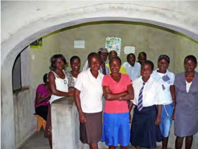
Peer educators in het nieuw gebouwde jongeren centrum in Sakubva

te worden, is het eigenlijk nog een van de grootste taboes. Het gesprek gaat nooit over wat er prettig, fijn of leuk kan zijn aan seks. En hoe je ook van seks met je geliefde kan genieten. Nee, seks is alleen de grote boosdoener van een ziekte die bijna een hele generatie in Afrika weggevaagd heeft.