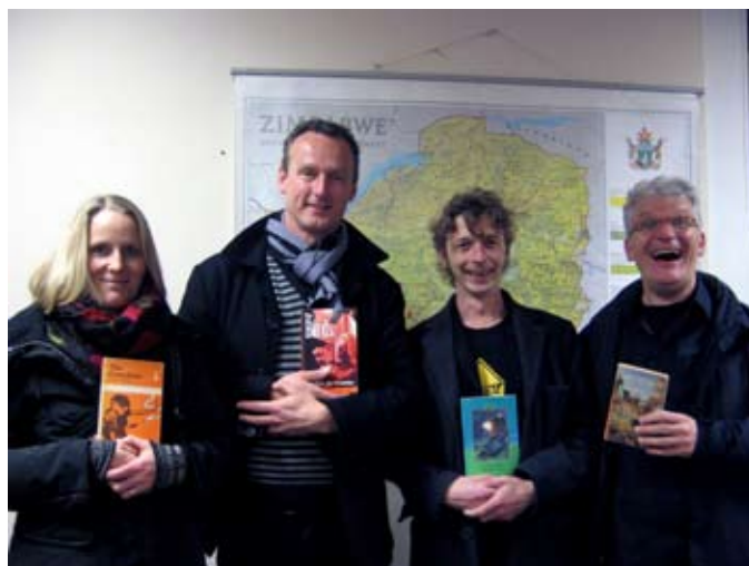
Bezoekers aan LEESHONGER.

De gemeenten, Lochem, Groningen, Amsterdam en Haarlemmerliede en Spaarnwoude willen burgemeesters van steden waar de oppositiepartij MDC aan de macht is uitnodigen om naar Nederland te komen. Het onderwerp: goed bestuur, goed financieel beheer en onderhoud voorzieningen. De Stedenband dringt er bij het gemeentebestuur van Haarlem op aan om de burgemeester van Mutare ook uit nodigen.