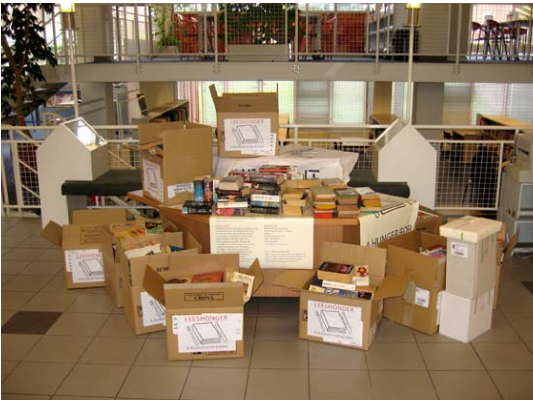
Inzampelpunt in de bibliotheek

Terugkijkend is het heel bijzonder dat LEESHONGER zo snel uit de grond is gestampt. En we hebben veel geleerd, wat wel moet en wat niet. Want wat mij betreft mag het zich volgend jaar herhalen. En dan liefst niet alleen in Haarlem, maar graag samen met een andere stad of meerdere steden. Maar hoe we dat dan weer moeten organiseren is werk dat