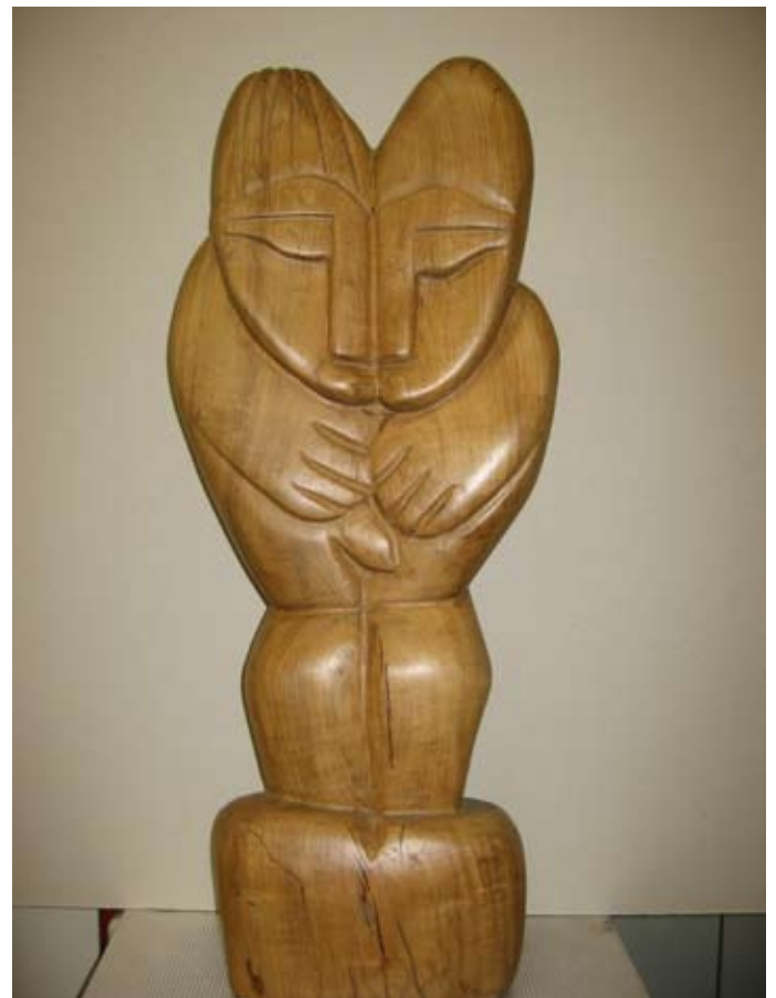
Two lovers, sculptuur, hout

Hold on your words, Leonard Tego, sculptuur, black serpentine