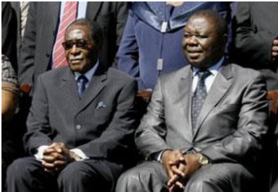
Mugabe en Tsvangirai (links)

leger, politie, veiligheidsdiensten en de justitie behouden. Deze machtsmiddelen misbruikt de Zanu-pf ingezet om haar greep op de samenleving te handhaven en de MDC te ondermijnen.