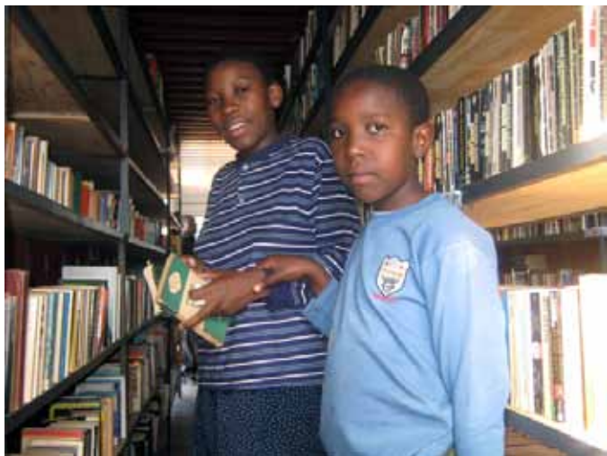
De bibliotheek in Hobhouse

Bij de start van het huisvestingsproject in 1998 was de nieuwe wijk Hobhouse nog een verzameling huizen in de leegte. Nu is het een levendige wijk met 20.000 inwoners, komen er scholen, bedrijfjes, een kliniek, een bibliotheek. Natuurlijk