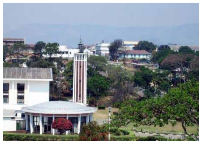
Het centrum van Mutare

We maken van deze gelegenheid ook gebruik om reclame