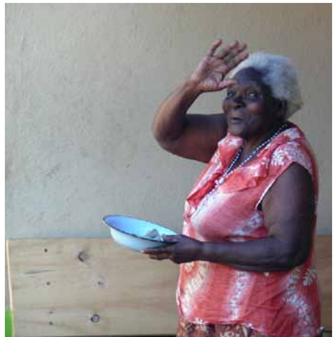
Een van de ouderen in Zororai.