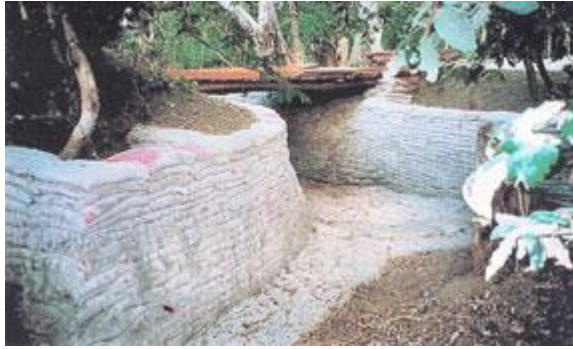
Burg in Nicaragua gebouwd met cementzakken

Wat in Nicaraguaanse bergriviertjes kan worden gebruikt, kan ook in Zimbabwaanse bergriviertjes. Mutare is omgeven door bergen en in de regentijd zwellen de riviertjes fors aan. Plaatsen die anders eenvoudig over te steken zijn, worden geheel onbegaanbaar. Jaarlijks vallen er doden omdat mensen het er toch op wagen en worden meegesleurd. De bruggenhoofden zijn tegen relatief lage kosten te bouwen. Cement, grind, een cementmolen, jute zakken en flink wat spierkracht is alles wat je nodig hebt. Voor de rest is een brugdek nodig dat van diverse materialen – hout, metaal, beton – kan worden gemaakt.