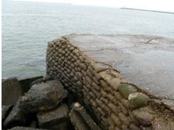
De noordpier IJmuiden gebouwd met cementzakken